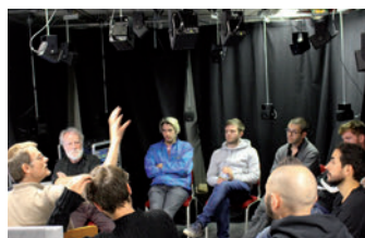
ACROE, atelier de création, 15 mai 2018